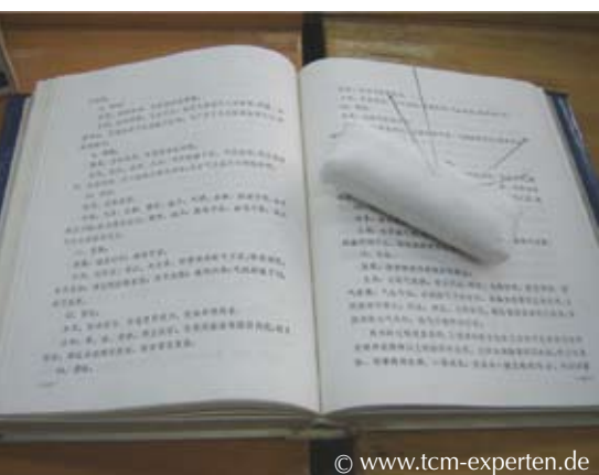
Bild 3: Chinesisches Lehrbuch, Kapitel Pulsqualitäten. Im Übungskissen Akupunkturnadeln mit Silberwendelgriff für Grundkurs Teilnehmer.

Deutsche Lehrbücher, mit teilweise liebevollen Darstellungen