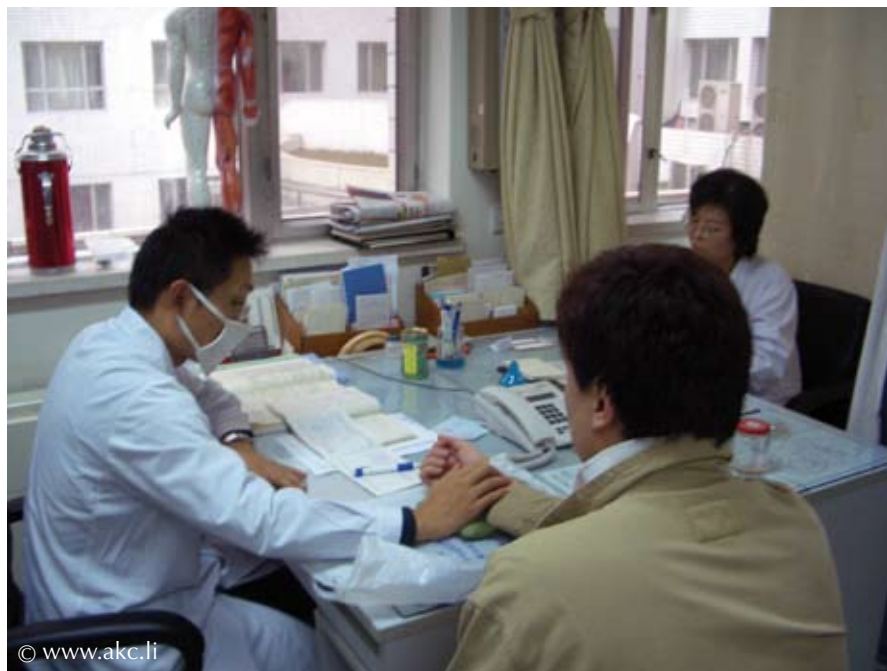
Bild 2: Wesentliches Element der täglichen klinischen Diagnostik im heutigen China ist die Pulsdiagnose; www.akc.li

lich“, „tief“, „rollend“, „rau“ etc. beschrieben, bzw. aus dem Chinesischen vielleicht manchmal zuerst ins Englische und dann ins Deutsche übersetzt.