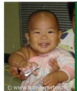
Der zufriedene Akupunkturpatient